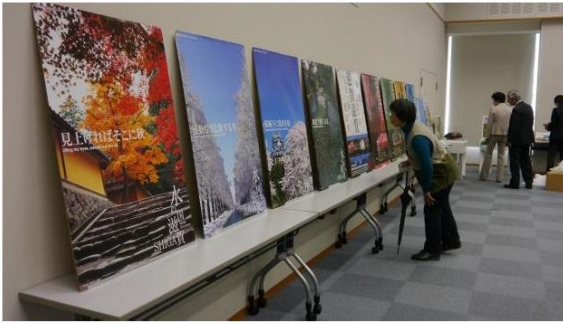
滋賀県関連パネルの設営