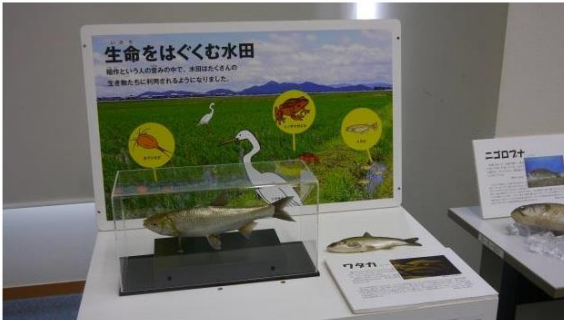
びわこの魚模型等の展示設営