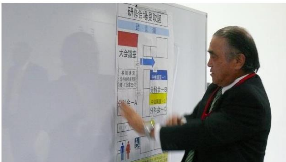
会場案内および各部屋の表示