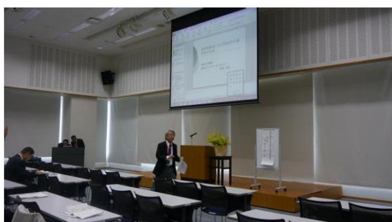
基調講演会場設営