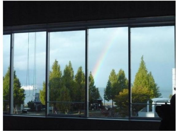
丁度、閉講式の時に琵琶湖に虹がかかる